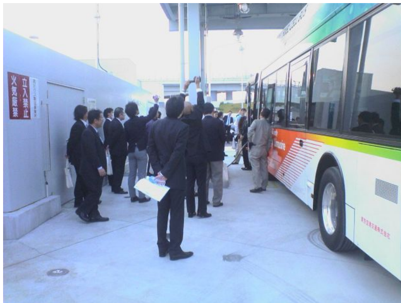
【燃料電池バスへの水素充填デモンストレーション】

成田国際空港エコ・エアポート推進協議会； http://www.narita-airport.jp/eco/event_information/index.html