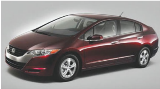
ホンダ FCX クラリティ