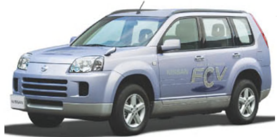
日産 X-TRAIL FCV