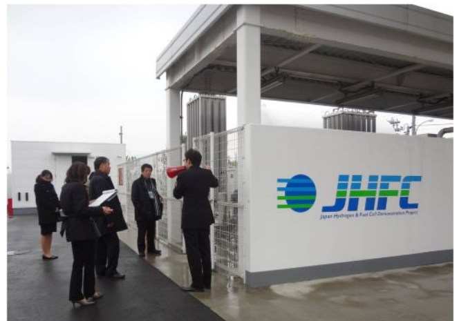
【有明水素ステーション見学会】