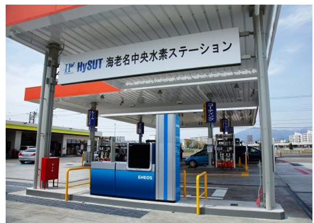
水素充填機(中央青い部分) 奥にガソリン計量機が並ぶ