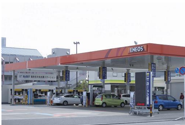
水素ステーション外観(左側部分) (右側はセルフガソリンスタンドエリア)