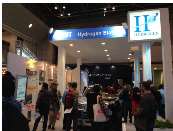
写真3 HySUT ブース賑わい光景