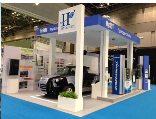
写真2 HySUT 展示ブース全体写真