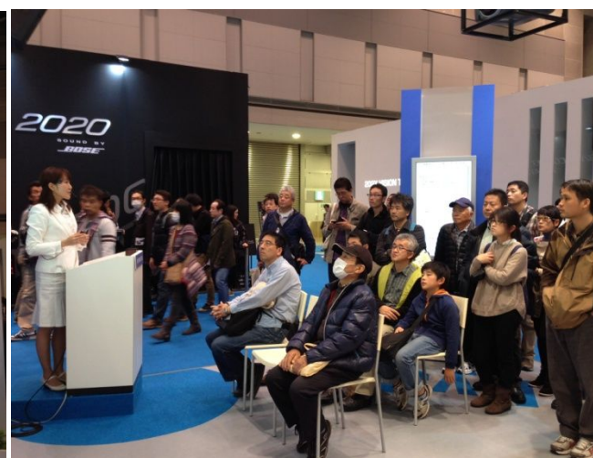
写真4 HySUT 展示ブースミニイベント光景