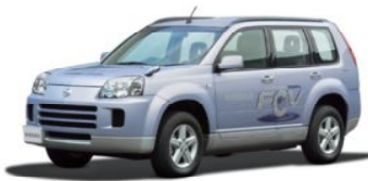
X-TRAIL FCV 日産自動車(株)