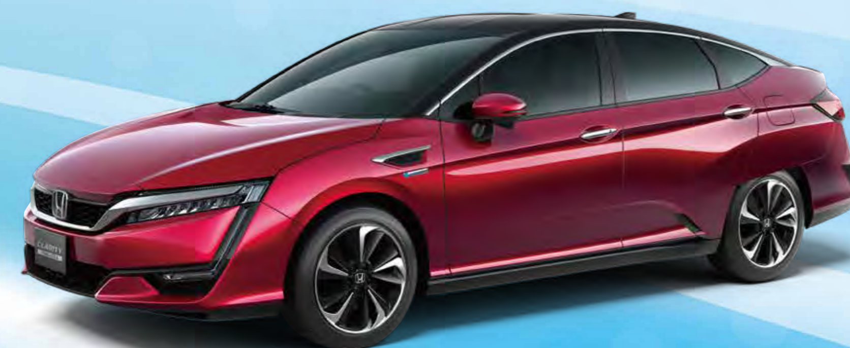
ホンダ CLARITY FUEL CELL