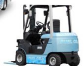
燃料電池 フォークリフト