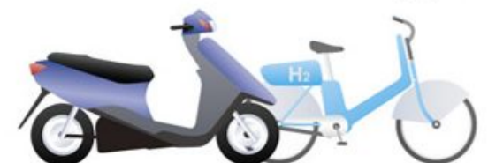
燃料電池スクーター、燃料電池自転車 など