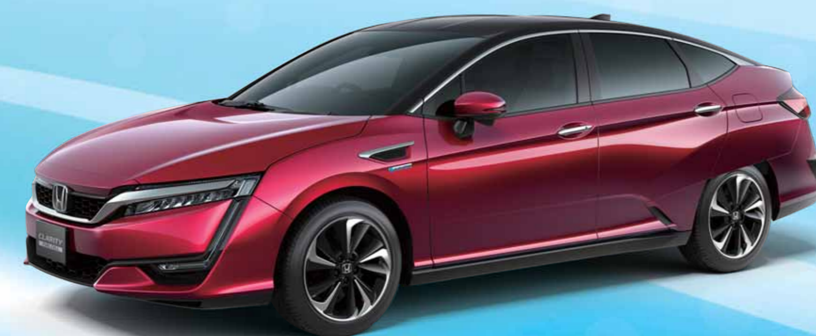
ホンダ CLARITY FUEL CELL