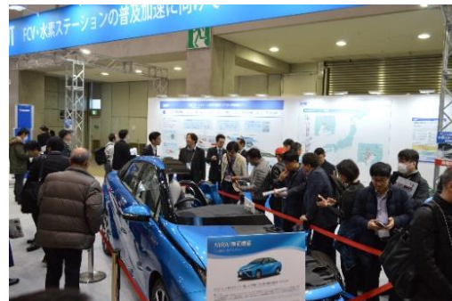
会期中のブース風景①