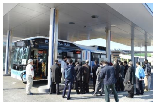
伊ワタニ水素ステーション東京有明見学風景②