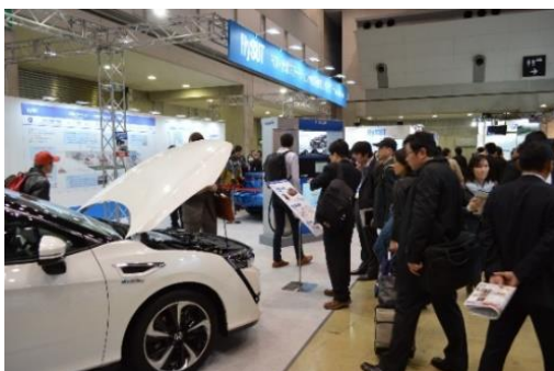
会期中のブース風景②