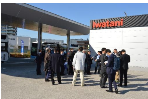
伊ワタニ水素ステーション東京有明見学風景①