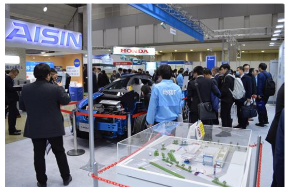
会期中のブース風景②