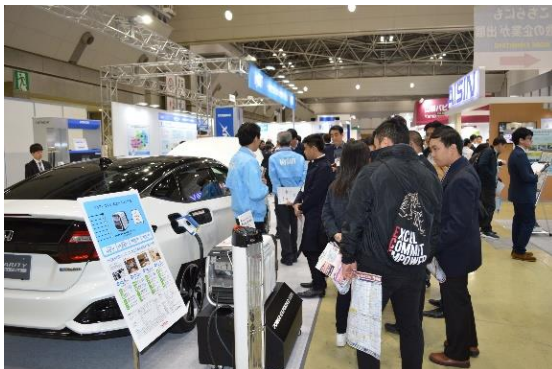
会期中のブース風景①

※トヨタ自動車(株)のFCバスの試乗会を今年も行いました。FCバス試乗会では受付開始と同時に定員に達する盛況ぶりでした。FCバス試乗会ではFCバス、水素ステーションに関する説明を行い、参加者からの質問も多く寄せられました。