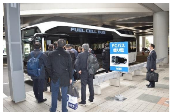
FCバス試乗会乗場風景